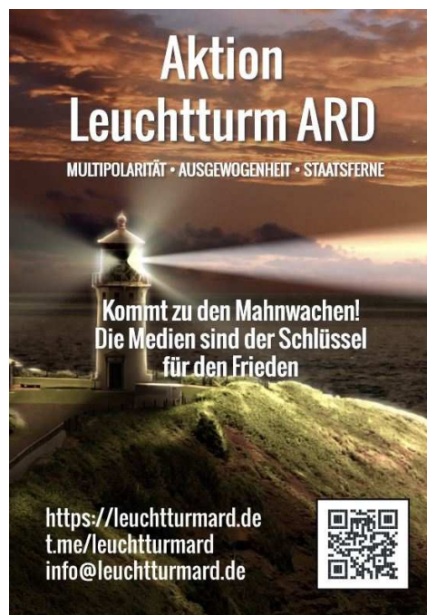
Plakat A 1

Alle Flyer erhältlich z.B. bei www.saxoprint.de